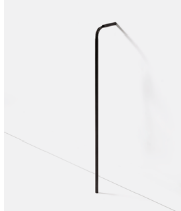
Vaso Solo — Black Aluminum SL01.01