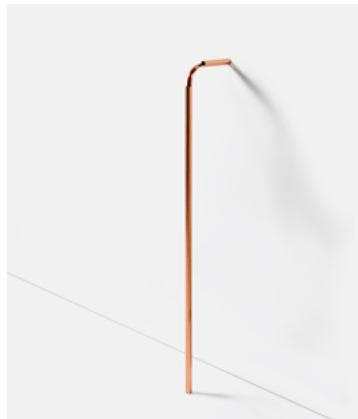
Vaso Solo — Cobre SL01.12