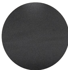
Couro Preto L01