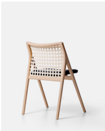
Tauari Lavado TL11.24