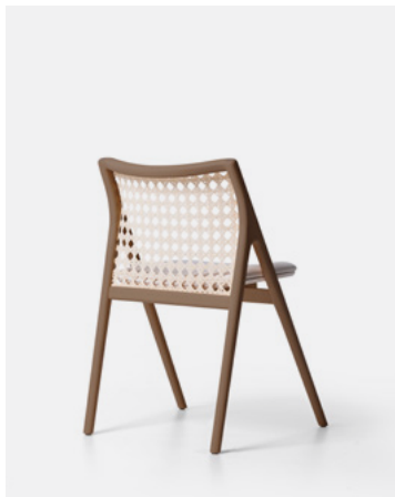
Tauari Castanho TL11.25