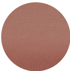
Couro Terracota L04