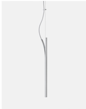
Luminária Pendente Cana — Branco CN01.02