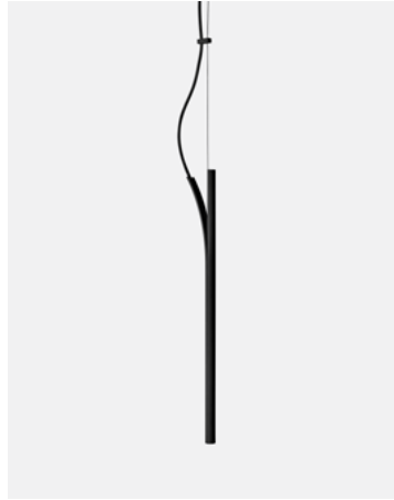
Luminária Pendente Cana — Preto CN01.01