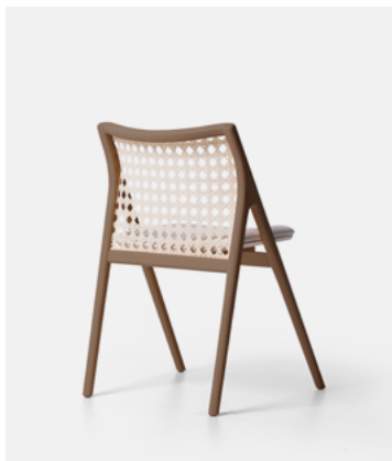
Tauari Castanho TL11.25