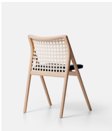
Tauari Lavado TL11.24