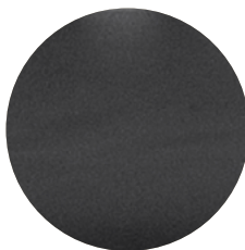
Couro Preto L01