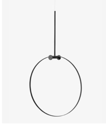
Cabideiro Argola – Preto AG01.01