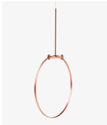
Cabideiro Argola – Cobre AG01.12