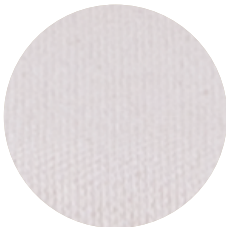
Algodão Reciclado Cru