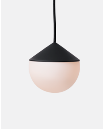
Luminária Pendente Tombo — Preto TB11.01