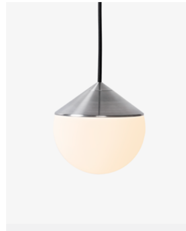
Luminária Pendente Tombo — Inox TB11.13