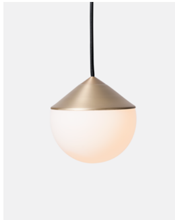
Luminária Pendente Tombo — Latão TB11.11