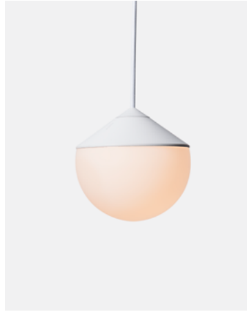
Luminária Pendente Tombo — Branco TB11.02