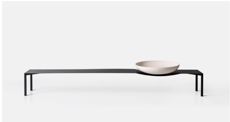
Mesa Bowl G BW02.01