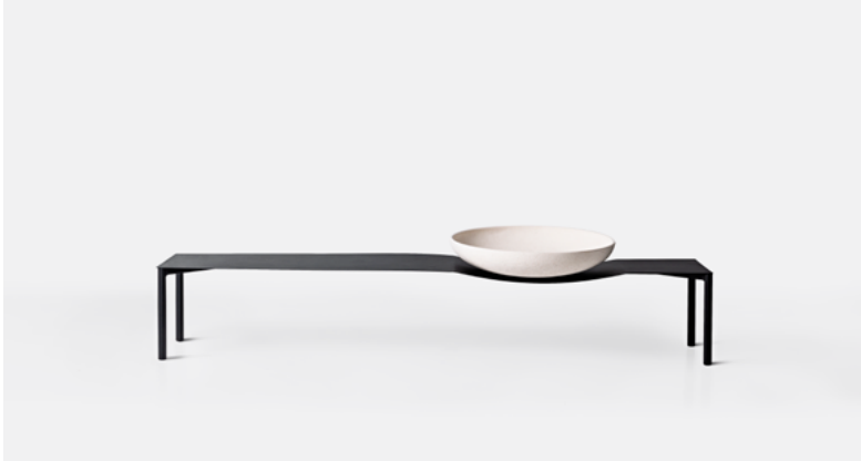
Mesa Bowl P BW01.01